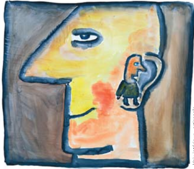
« Voix intérieure » artisanale

Nous sommes si importants que le Dieu du Paradis, le soutien de toutes choses, a créé des gouvernements d'univers, des systèmes judiciaires, des enseignants pour nous enseigner, des séraphins pour nous guider et un gigantesque nombre d'êtres pour nous venir en aide dans notre voyage à destination du grandiose but que Dieu nous réserve, quel que soit ce but. J'aime dire aux gens que Dieu a un plan pour notre vie... Mais ce n'est pas cela. Je travaille dans une aciérie. Est-ce là ce que Dieu veut pour ma vie? Non. Dieu a en réserve quelque chose de beaucoup plus important et de beaucoup plus grandiose pour vous et moi qui nous attend quelque part dans l'éternité.