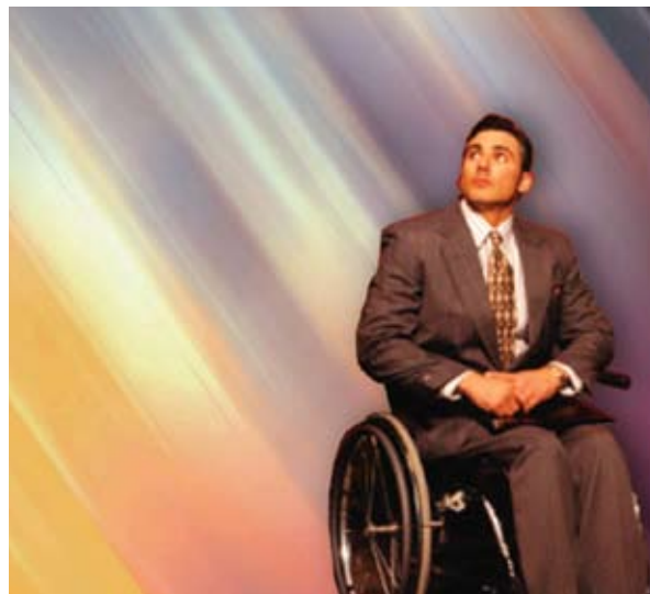
« guérison » collage

L'homme qui connaît Dieu décrit ses expériences spirituelles non pas pour convaincre les incroyants, mais pour édifier et satisfaire mutuellement les croyants [30:5]