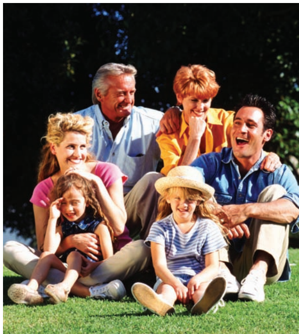
“Qui Suis-je?” photo.