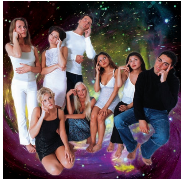
"Qui Suis-je?" collage.

D'une importance particulière est pour moi l'usage urantien du mot personnalité . Vous pourriez me demander : pourquoi? Je vous dirais que c'est parce que cette application particulière du mot a permis d'exprimer une pensée qui, jusque là, avait été