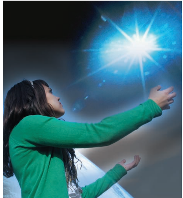
*Qui Suis-je? collage.

Je crois que c'est la petite-fille de Deepak Chopra qui a dit un