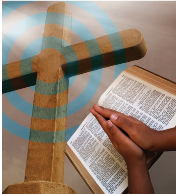
"Le Livre d'Urantia et ma Foi Chrétienne" collage.

Donc, quand ma conductrice de bus me dit que Jésus voulait me connaître personnellement, être mon ami, cela me parut tout nouveau et suffit à exciter mon imagination enfantine. "Oui," répondis-je et j'y croyais.