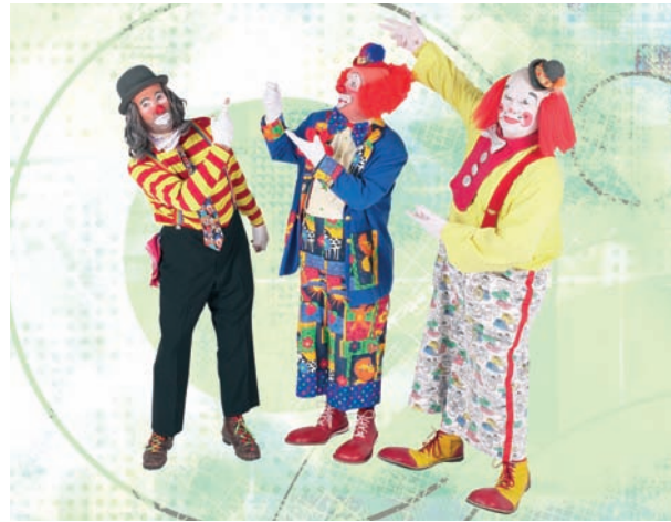
"La seconde lieue" collage.

Jésus ne faisait pas de distinction entre sa vie et son oeuvre. Quel que soit le travail, Jésus l'utilisait comme façon de servir sa carrière mortelle et divine. Jésus était un enseignant. Ses leçons portaient sur l'amour et sa méthode était le service. On peut voir l'organisation de Jésus depuis sa vie de famille et se développer à travers sa campagne publique. Au foyer de Nazareth, ceux qui pouvaient aller à l'école instruisaient ceux qui ne le pouvaient pas. Tandis qu'il se préparait à les quitter, non seulement il forma son frère Jacques à prendre en main les rênes de la famille,