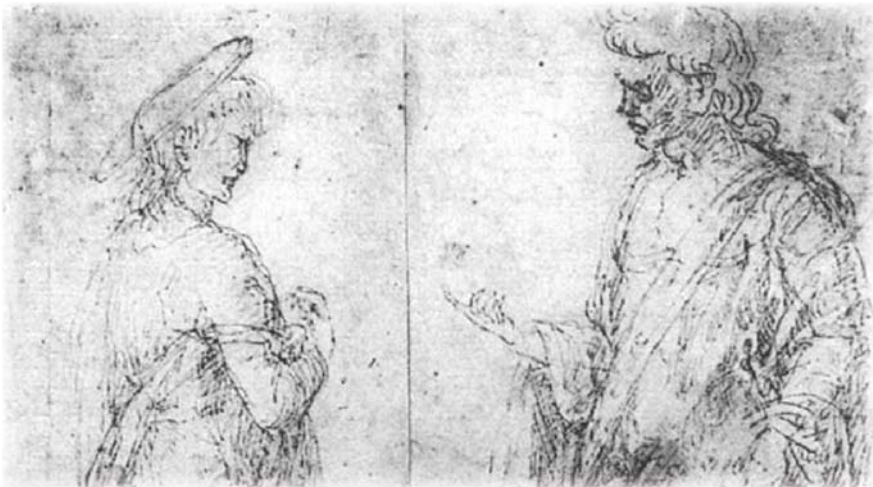
"Dos Apóstoles", Francesco di Giorgio Martini, 1490