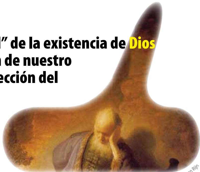
Detalle de una pintura de Rembrandt, Van Rijn