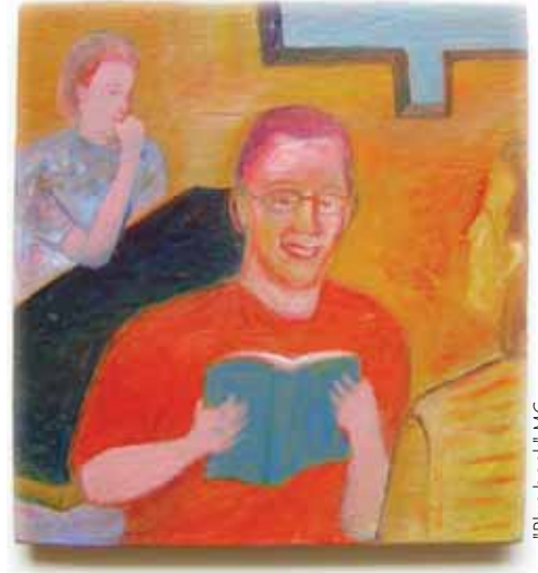
"Blue book" MC

A medida que Jesús crecía, iba desvelando menos información acerca de sí mismo (1391: 4-5). Disociaba las fases de su carrera (1423: 5-8). Evitaba hablar de la voz escuchada en su bautismo (1545: 4). Se abstuvo de predicar públicamente durante la fase más temprana de trabajo del reino (1538: 3). Prohibió censurar al César o sus servidores y dijo a los apóstoles que no se metieran en líos políticos, sociales y económicos (1542: 5, 1580-81). Intentó mantener su poder curativo en calma. Presentó sus enseñanzas en parábolas, en parte como medida defensiva para confundir a los oyentes superficiales (1749: 4). Impartió una enseñanza especial a aquellos (por ejemplo, Natanael) que estaban preparados para ella y que prometían no compartir con los demás (1767: 4). Restringió algunos encuentros para consejo y planificación a aquellos que eran discípulos probados y demostrados (1717: 4). Destacamos también su respuesta selectiva a las preguntas en su juicio (1979: 3, 1982: 7, 1983 c; 1984:2, 1986: 3, 1990 d, 1992: 5, 1996: 1). También ▶