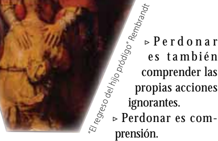
“El regreso del hijo prodigo” Rembrandt