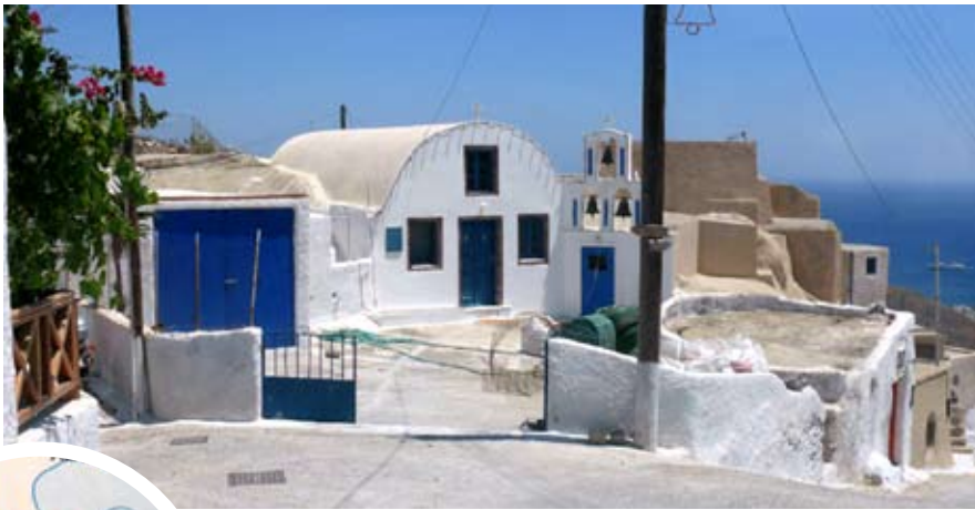
A casa em Santorini onde Pio esteve