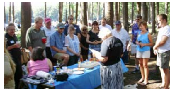
Leitores de New England - Parque Estadual Hopkinton - Massachusetts