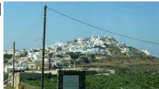
Colina de Santorini sobre a Caldera

dos membros prepararam uma apresentação temporal da outorga de Michael no 606. Foi uma empreitada difícil, mas agora podemos ter um vislumbre do difícil trabalho que os Medianos tiveram em editar a história de Jesus. Tudo parece muito importante e de valor para ser relatado. Apresentamos a linha de tempo até aos 29 anos do Mestre e foi quando ficamos com fome. Então fizemos uma pausa para jantar que foi precedido por uma prece. Não foram