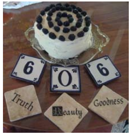
Très beau gâteau de fête du 2014e anniversaire de Jésus offert par

S AMEDI 16 AOÛT DERNIER AU PARC HOPKINTON dans le Massachusetts, l'Association Urantia de la Nouvelle - Angleterre en collaboration avec des lecteurs du Connecticut, se sont réunis pour célébrer la fête du Maître. Vingt personnes se sont présentées.