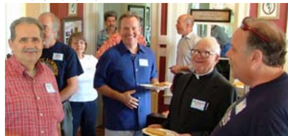
Étudiants du Livre d'Urantia en Ohio célébrant la fête de Jésus