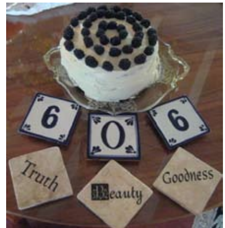
Très beau gâteau de fête du 2014e anniversaire de Jésus offert par

S AMEDI 16 AOÛT DERNIER AU PARC HOPKINTON dans le Massachusetts, l'Association Urantia de la Nouvelle - Angleterre en collaboration avec des lecteurs du Connecticut, se sont réunis pour célébrer la fête du Maître. Vingt personnes se sont présentées.