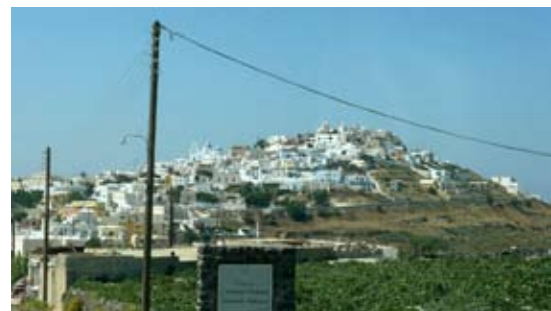
Vue de Caldera de la colline de Santorini,

Plusieurs lecteurs avaient préparé une « suite des événements » de l'effusion de Micaël sur la planète 606. Ce travail exigeant nous a donné un petit aperçu de la difficulté que les médians ont pu avoir à rédiger l'histoire de la vie de Jésus. Nous avons lu jusqu'à la 29e année et avons décidé de faire une pause pour le repas. Ce repas partagé précédé du sacrement a été parfait