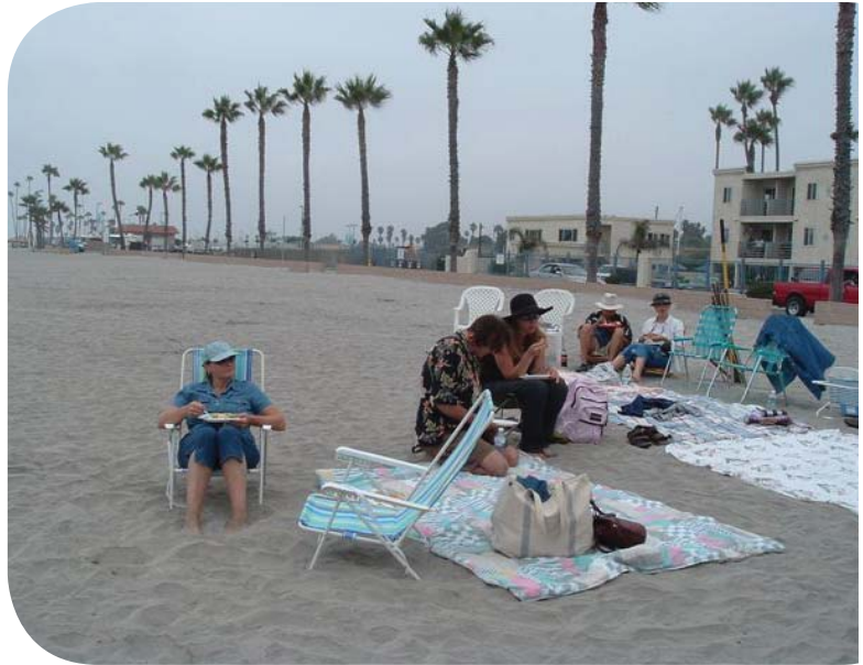
En la playa

Nunca hemos planificado esta comida. Nunca hacemos asignaciones de comida para este encuentro de lectores. La gente trae