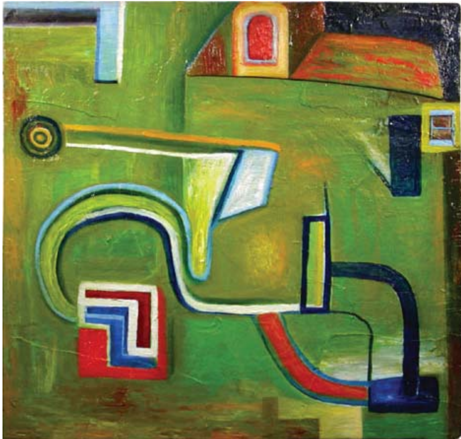
"Edificio verde" © Mario Caiole, Portland, Oregon