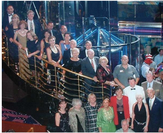
Noche de gala el viernes, en las escaleras del barco

Muchos se emocionaron hasta las lágrimas mientras se deseaban aloha los unos a los otros. Se han grabado tiernos recuerdos en nuestras mentes y almas y estamos todos agradecidos por esta experiencia de Crucero con los Intermedios para celebrar el cincuenta aniversario de la publicación de El Libro de Urantia original en 1955. □