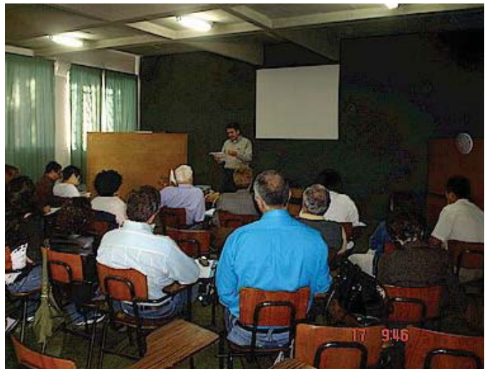
Una entre varias presentaciones