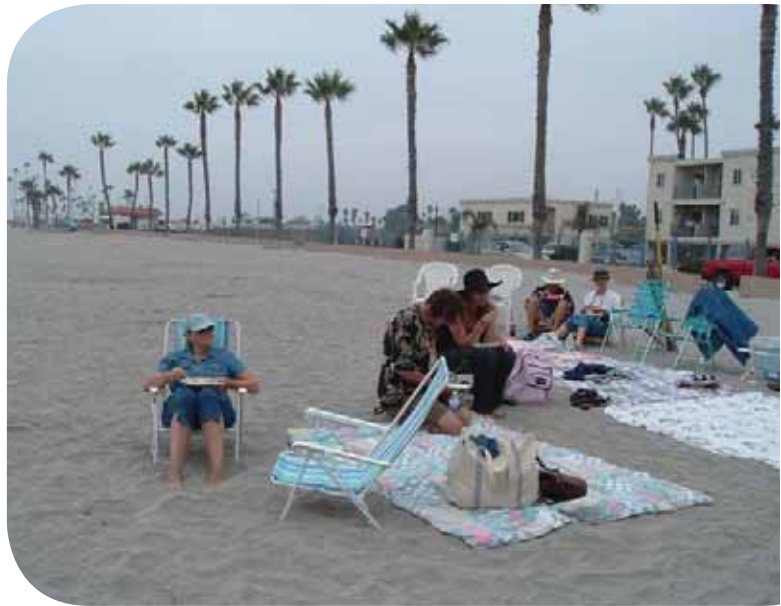
En la playa

Nunca hemos planificado esta comida. Nunca hacemos asignaciones de comida para este encuentro de lectores. La gente trae