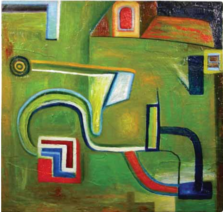
"Edificio verde" © Mario Caolte, Portland, Oregon