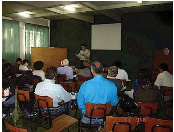
Una entre varias presentaciones