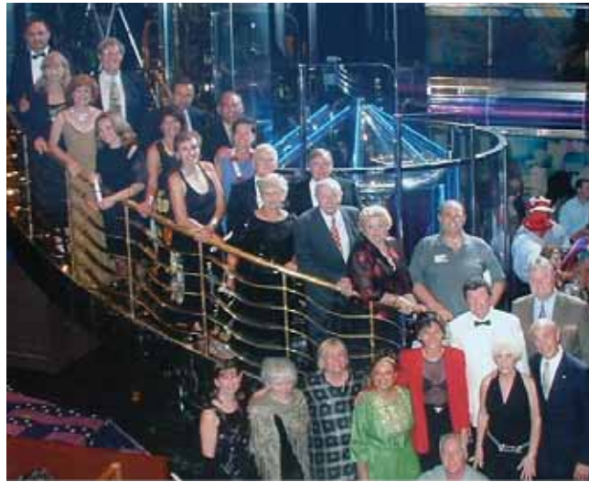
Noche de gala el viernes, en las escaleras del barco

Muchos se emocionaron hasta las lágrimas mientras se deseaban aloha los unos a los otros. Se han grabado tiernos recuerdos en nuestras mentes y almas y estamos todos agradecidos por esta experiencia de Crucero con los Intermedios para celebrar el cincuenta aniversario de la publicación de El Libro de Urantia original en 1955. □