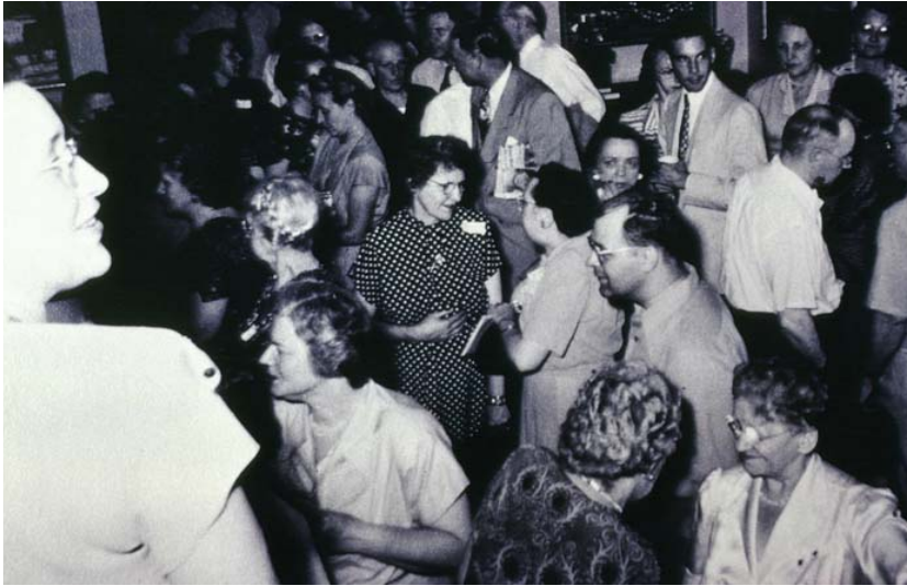
Fiesta del Forum, años 30