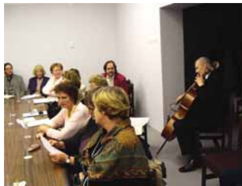
Cellist Peeter Paemurru interpreta a Bach.