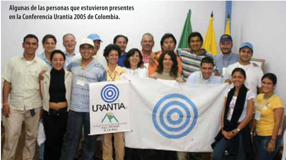
Algunas de las personas que estuvieron presentes en la Conferencia Urantia 2005 de Colombia.