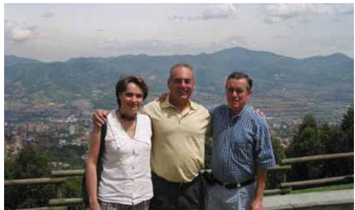
Amigos en Medellín

toda belleza y exalta toda bondad. Por medio de símbolos inteligentes, el hombre es capaz de vivificar y ampliar la capacidad de apreciación de sus amigos. Este poder y esta posibilidad de estimulación mutua de la imaginación es una de las glorias supremas de la amistad humana. Existe un gran poder espiritual inherente en la conciencia de estar consagrado de todo corazón a una causa común, de ser mutuamente fieles a una Deidad cósmica. LU □