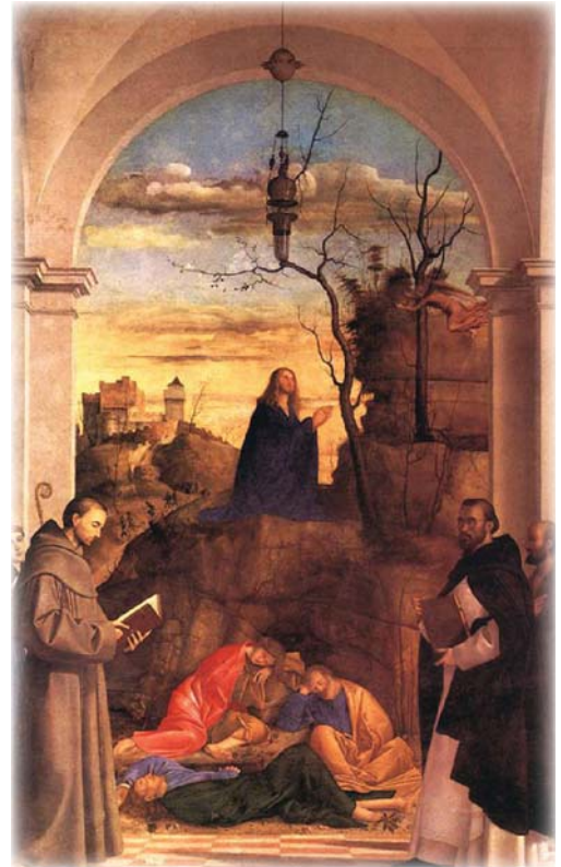
"Cristo rezando en el Jardín" Marco Basaiti, óleo en tabla, 1516

A mi amado Padre-Madre y a mi familia Sin los que yo sería sencilla y verdaderamente, nada