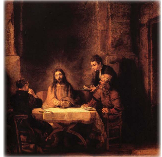
"Cena en Emaús", Rembrandt van Rijn, 1629

Si elegimos hacer la voluntad del Padre, Entonces la supervivencia será Su regalo. Nuestra muerte Se convertirá en una nueva vida.