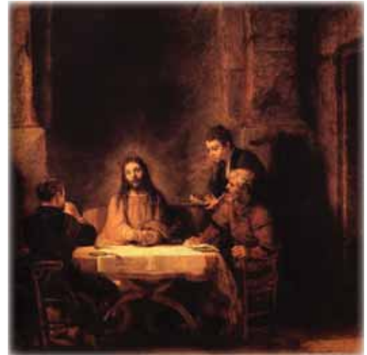
"Cena en Emaús", Rembrandt van Rijn, 1629

Si elegimos hacer la voluntad del Padre, Entonces la supervivencia será Su regalo. Nuestra muerte Se convertirá en una nueva vida.