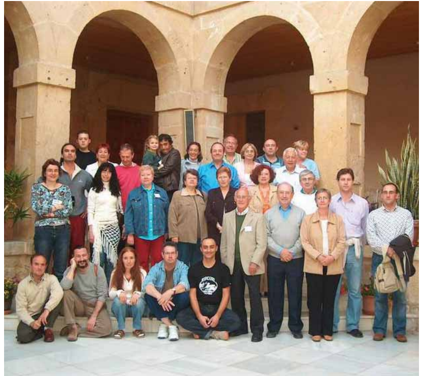
Foto de grupo

Bilbao, Valencia, Burgos y Mallorca, entre otros sitios. Incluso una pareja de amigos que viven en Francia, cerca de la frontera española, vinieron para estar con nosotros en este evento. Entregamos una serie de material a los allí presentes, como un CD con trabajos