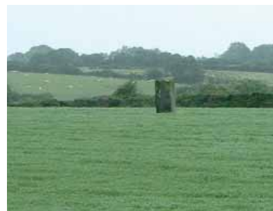
Megalito de Muff