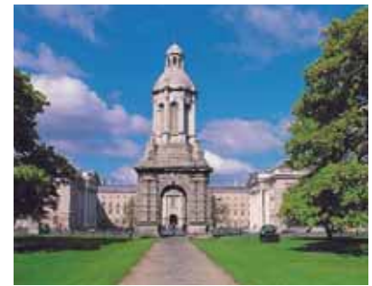
Trinity College, Dublin

Las escaleras de escalones interiores se replegaban hacia arriba de modo que el enemigo no pudiera alcanzar la cima. Si alguna vez van a Irlanda, deben visitar este lugar, es un sitio asombroso. Me sentí feliz de que el Trinity College tuviera finalmente un Libro de Urantia , y recé para que algún día todas las bibliotecas universitarias de este planeta tuvieran pronto un LU en sus estanterías.