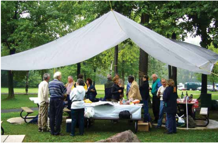
Picnic en Montréal