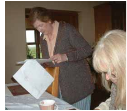
La guardiana del Megalito