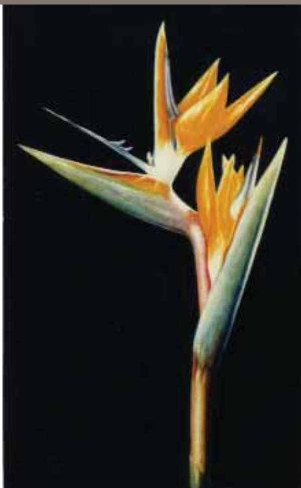
«Pájaros del Paraíso» óleo sobre tela de Carlos Rubinsky (Buenos Aires, Argentina)