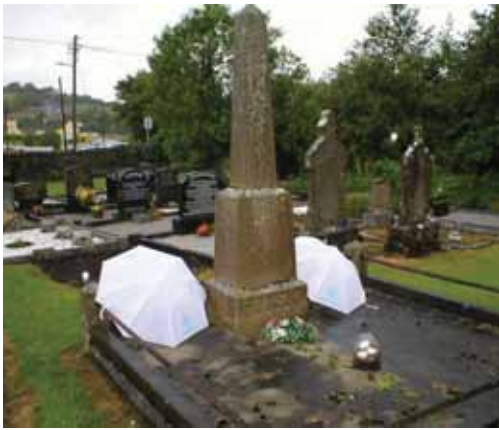
Lápida de familia Graham

final de nuestro viaje de dos semanas por la Isla Esmeralda.