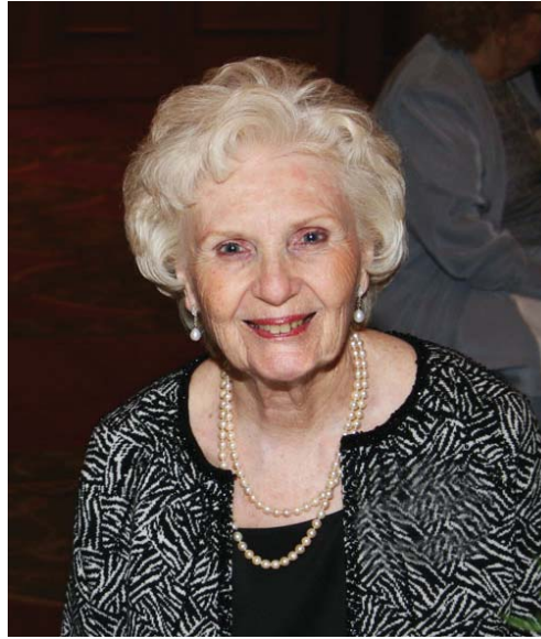
Dorothy en Chicago

Pero volvamos a marzo de 1968. Ese año comenzó con mucho estrés e incertidumbre. Mi marido había estado enfermo durante un tiempo, entraba y salía del hospital y no podía trabajar. Su enfermedad era muy seria y debilitadora, y como el futuro era muy incierto yo sentía mucha tristeza, miedo y preocupación. Por aquel tiempo mi madre empezó a hablarme de un libro que había encontrado y que contenía todas las respuestas; un libro que había sido escrito por los ángeles y que lo contaba todo sobre Jesús y el universo. Ella seguía insistiéndome en que consiguiera el libro, pero cuanto más insistía ella