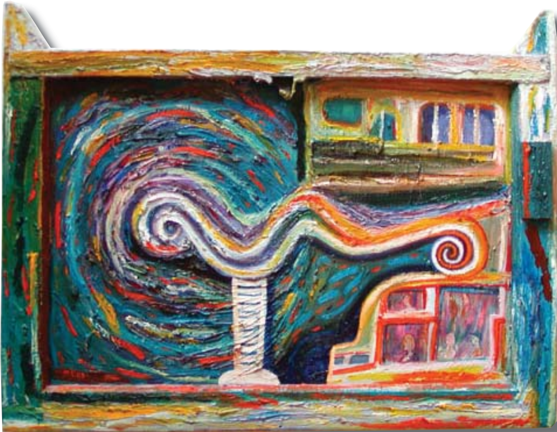
"Pasajeros", óleo sobre ventana, pintura de M. Caoile