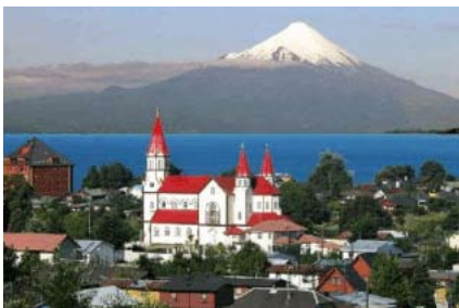
Puerto Varas Escenico

Los libros del autor español J.J. Benítez comenzaron a leerse en todo Chile (Benítez