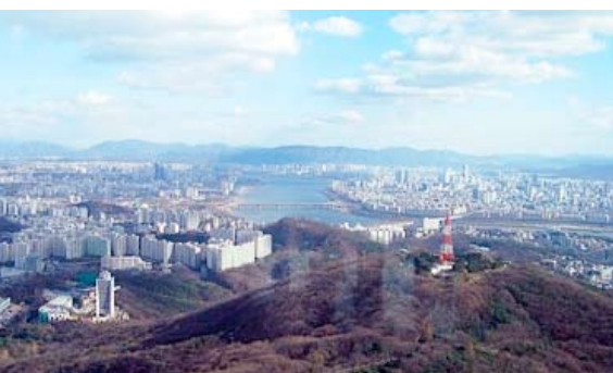
Vista de Seúl, la capital de Corea