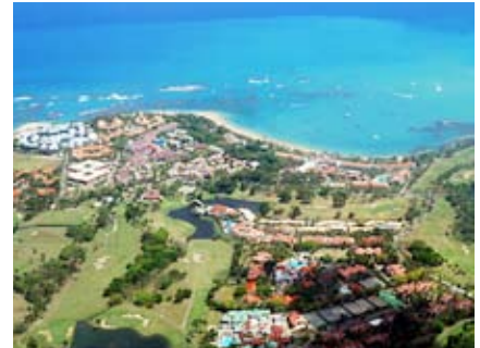
Vista aérea de Santo Domingo, la capital, que muestra el paisaje tropical que atrae a tantos visitantes.

un libro, así que decidimos que mi hermano lo leería primero. Yo podía leer en esos breves momentos en los que mi hermano lo dejaba. Las historias y las respuestas del libro me llevaron a crear una nueva perspectiva cósmica y mi mente comenzó a expandirse. La muerte inminente de mi padre perdió su aspecto trágico y las conversaciones con él se hicieron más placenteras y profundas.