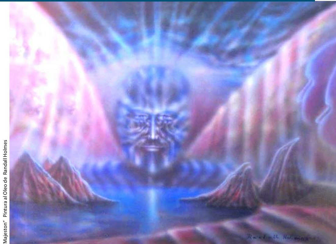
"Majeston" Pintura al Oleo de Randall Holmes