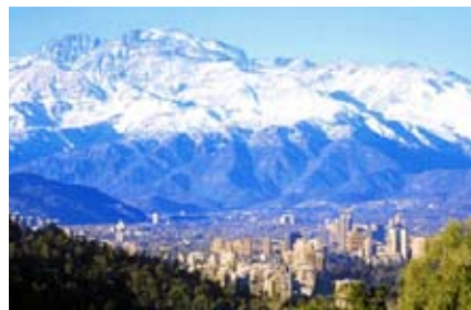
Santiago de Chile con la Cordillera de los Andes cubierta de nieve al fondo..

después de divorciarnos de nuestras respectivas parejas. Desde entonces hemos estado juntos y felices compartiendo nuestra vida.