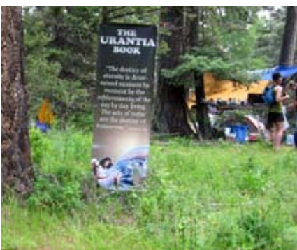
Pancarta del 'Campamento Urantia' con una cita del Libro