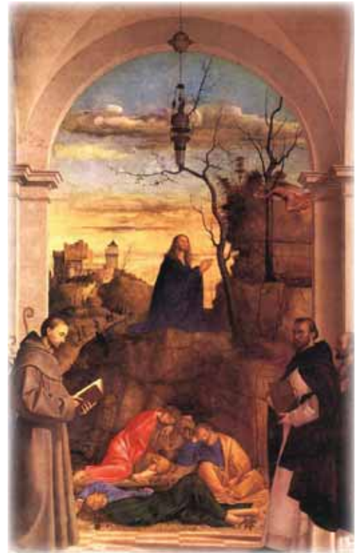
"Le Christ priant dans le jardin" Marco Basaiti, peinture à l'huile, 1516

Avec le cadeau divin de Dieu D'assurance bénie Nous sommes habilités à faire confiance à Dieu Assez même pour cesser de penser Quand nous choisissons ainsi Avec le cadeau divin de Dieu de Libre arbitre Nous sommes habilités à choisir consciemment Simplement d'aimer chacun L'amour de Dieu Avec notre désir humain suprême et le cadeau divin de Dieu Nous sommes habilités pour être Des mortels glorifiés Simplement par la volonté d'être Dans la présence splendide de Dieu Nos pensées se plient, pâlisent, se fanent, et se dispersent Dans la lumière... Nous prenons l'envol... À Dieu appartient toute la gloire.