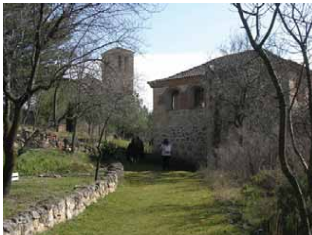
Monastère de San Juan de la Cruz à Segovia près de Madrid.