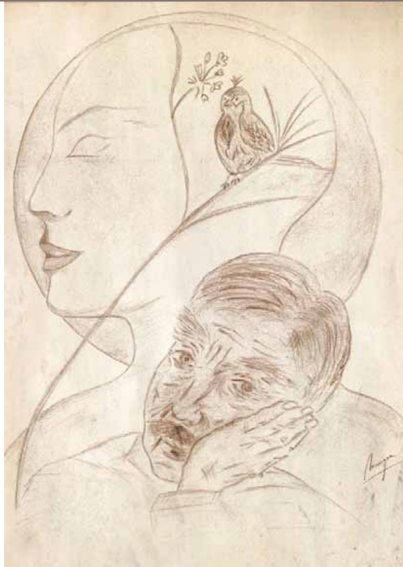
"La mélodie des âmes" dessin par Monique Fennes, Espagne