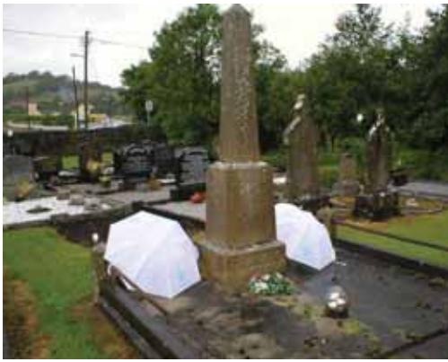
Pierre tombale de la famille Graham