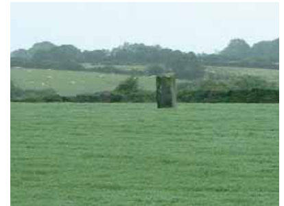
Mégalithe de Muff

Nous nous sentions bizarres de frapper ainsi à la porte de la maison d'un étranger, mais avons pensé que nous n'étions sans doute pas les premiers à le faire. Une femme est venue ouvrir tout de suite et je lui ai dit.