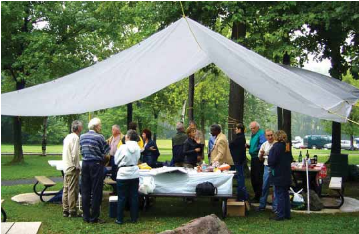
Pique-nique à Montréal