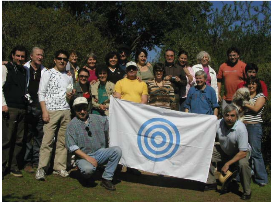
Photo de groupe. Pour plus de photos, allez au http://www.urantia-uai.org/photos/