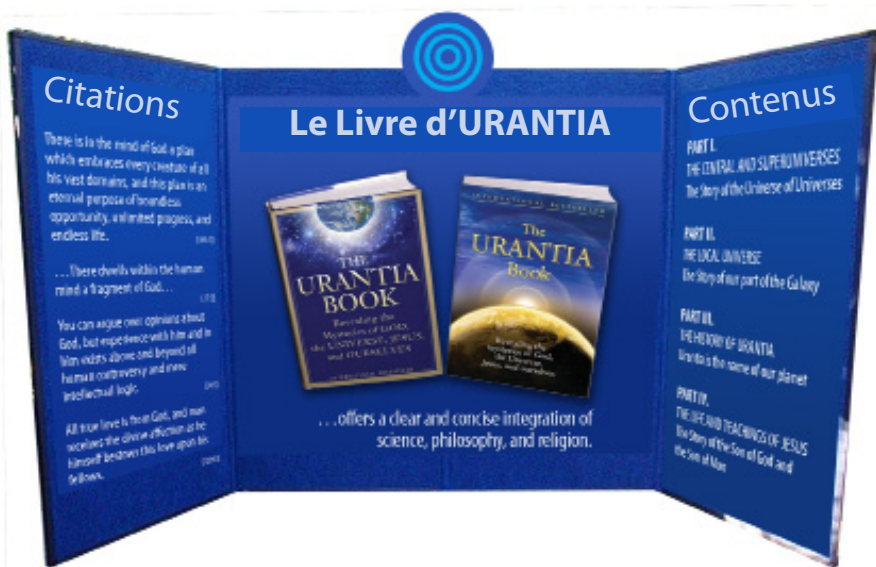
Notre brochure au kiosque du Livre d’Urantia

Le thème du Parlement des religions du Monde 2009 était le suivant :