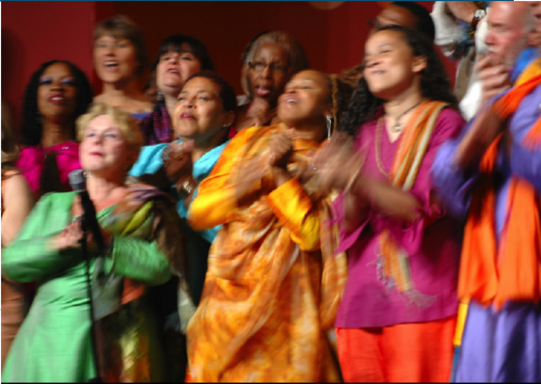
Photo. La chorale Agape au Parlement des religions du Monde, Melbourne Australie