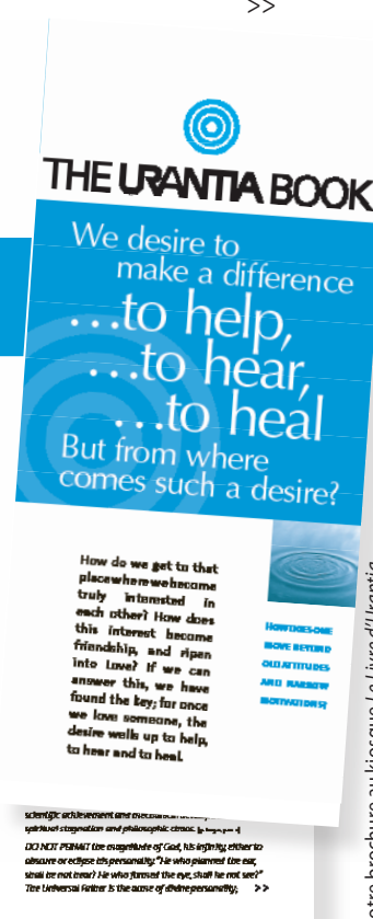
Notre brochure au kiosque Le Livre d’Urantia

The authors of The Urantia Book do not describe or advocate a new organized religion. They build on the religious heritage of the past and present, encouraging a personal, living religion based on faith and on service to one’s fellow. This spiritual awakening would launch a new and improved era of human relationships, so that we can realize social brotherhood on our planet and achieve lasting peace and good will through the spiritual transformation of each individual and all mankind.