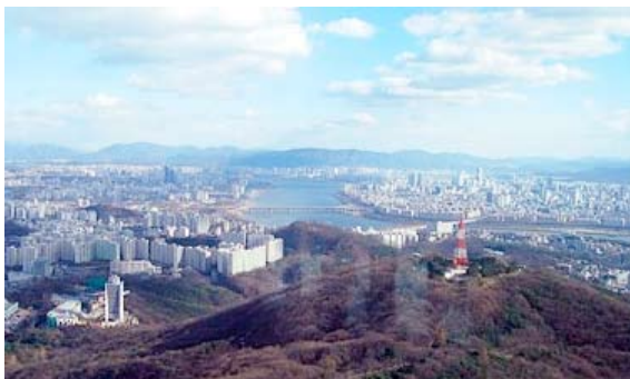
Photo de la vue prise dans l'observatoire de la Tour de Séoul