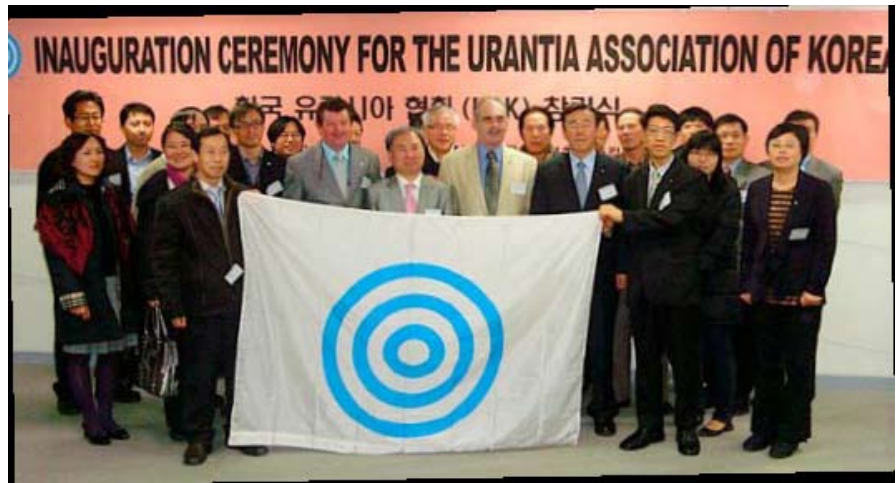
La photo de groupe de la nouvelle Association Urantia de Corée