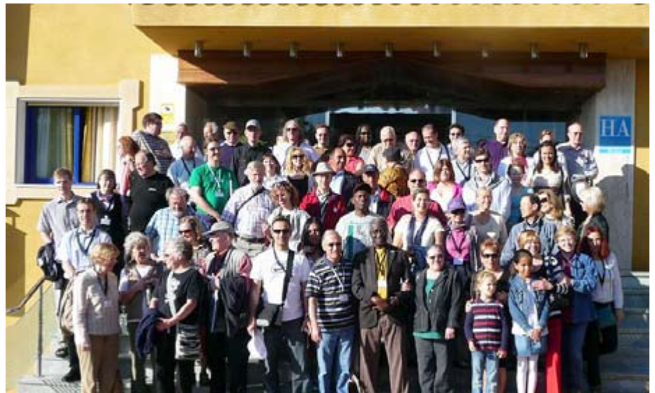
Photo de groupe au Congrès de l'Association Urantia international à Malaga en Espagne

L'organisation du dernier congrès fut un travail de longue haleine pour l'Association Urantia d'Espagne. Ce qui n'était qu'une idée en 2005 est devenu un projet en 2007 et n'est plus aujourd'hui qu'un très bon souvenir.