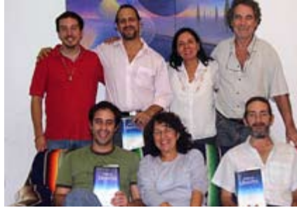
Groupe d'étude de l'Argentine

Ils se sont réunis le 23 mai et ont lu le fascicule 100. Ils ont vécu une belle expérience avec le sentiment bienveillant que plusieurs autres lecteurs à travers le monde étudiaient le même fascicule ce même weekend. ☐