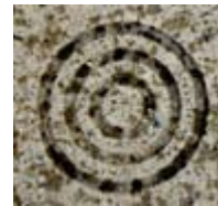
Tuile avec les cercles concentriques sur un trottoir à Malaga

L'année suivante, en 2007, le Conseil des représentants de l'AUI votait à l'effet que le congrès international se tiendrait dorénavant à tous les trois ans plutôt qu'à tous les deux ans. Ce qui amenait la tenue de cet événement à l'année 2009. Nous avons