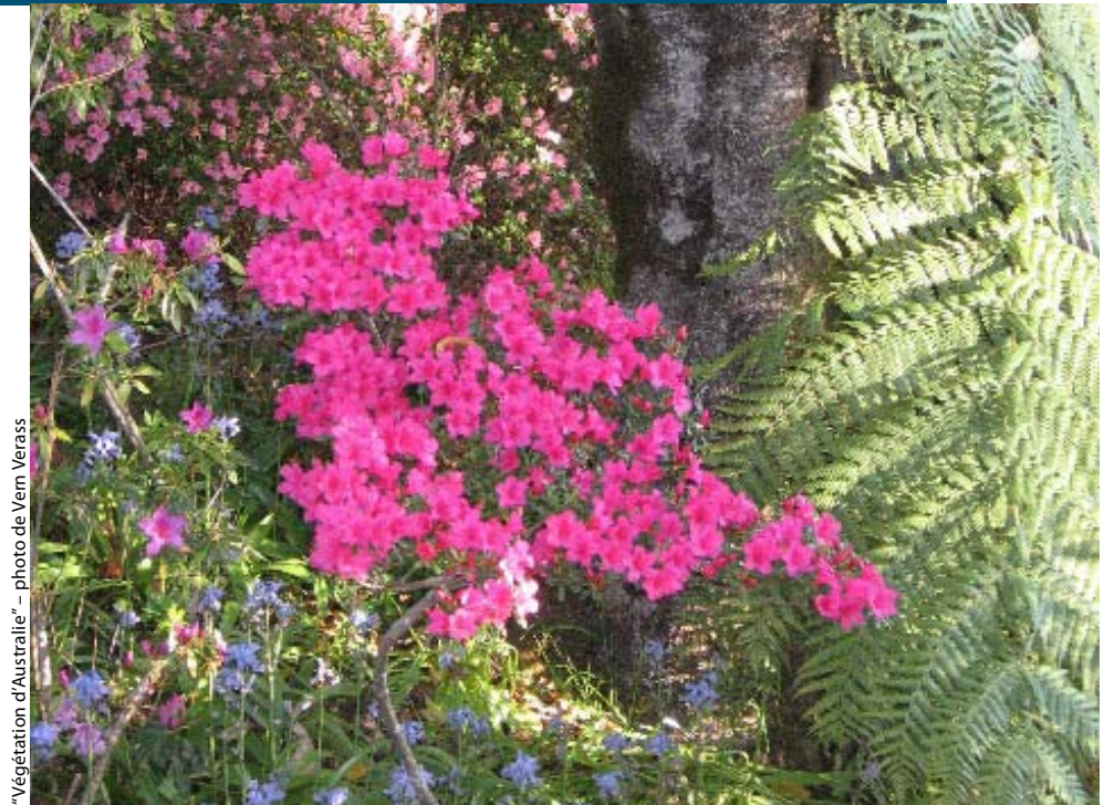
"Végétation d'Australie"