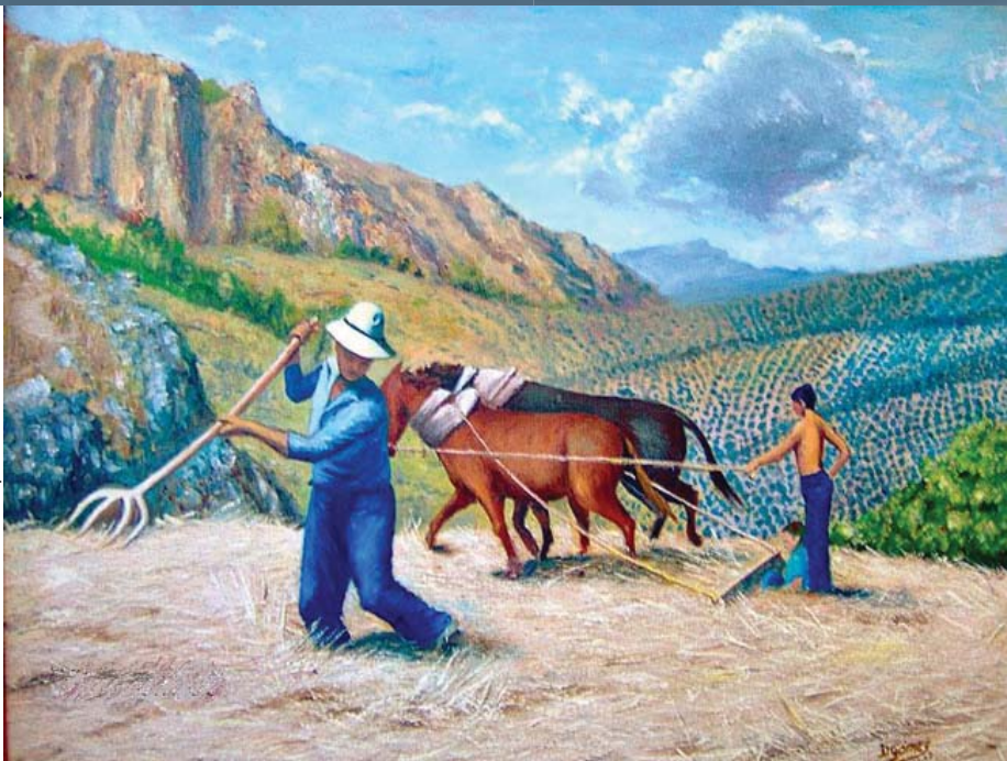
"La saison de la moisson" Peinture par Demetrio Gomez (Madrid, Espagne)