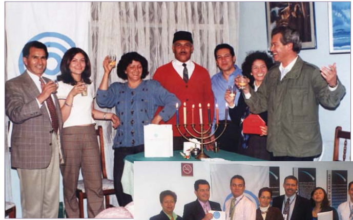
Photo de groupe no. 1 en haut Photo de groupe no. 2 à droite