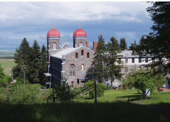
Monastère Ste-Gertrude à Cottonwood, Idaho

Au bas de la colline, à une distance d'un jet de pierre du monastère et à l'intersection d'une route de campagne, se trouve une vieille maison de ferme convertie en un petit centre de conférence. Il comprend une demi-douzaine de salles de bain, une très grande pièce de séjour, une cuisine fonctionnelle et peut accommoder une vingtaine de personnes. Cette vieille habitation avec sa vue imprenable